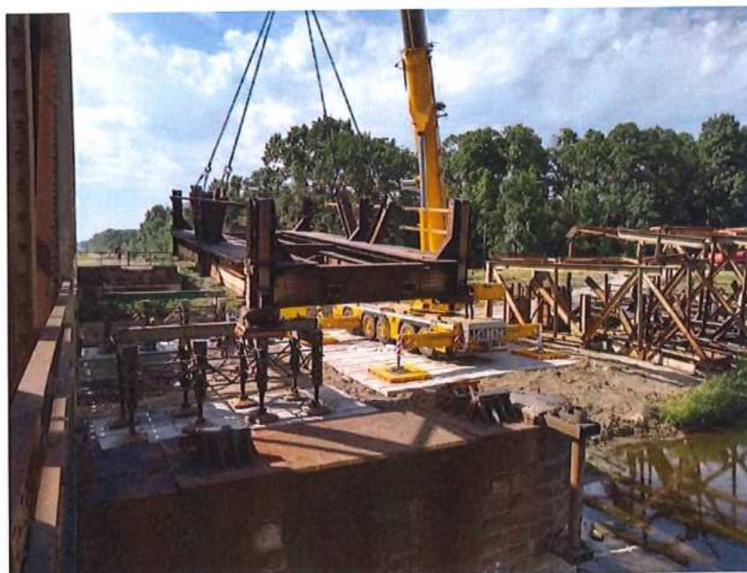
Pokračovanie demontáže MK na CZ strane