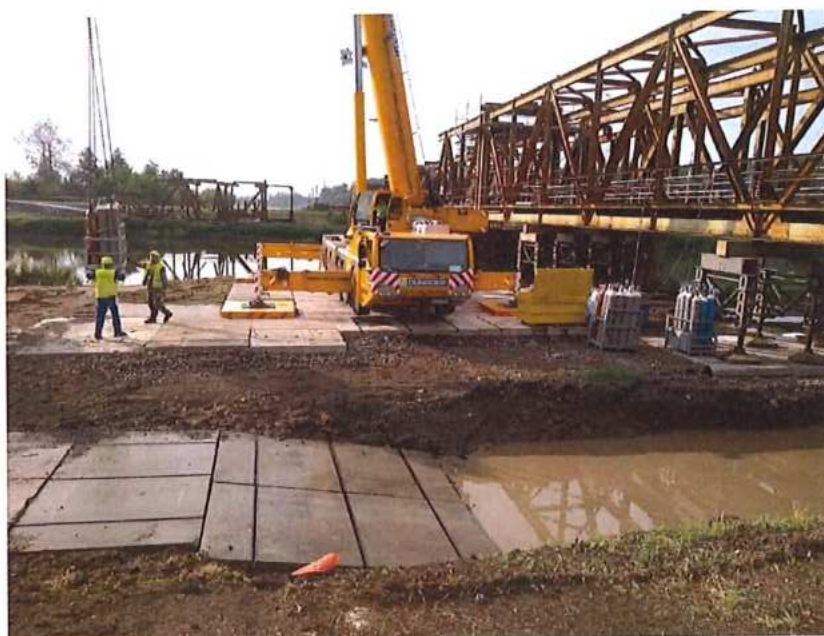
Príprava na demontáž MK na CZ strane