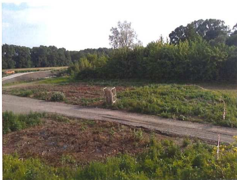
Odvezená MK na SK strane