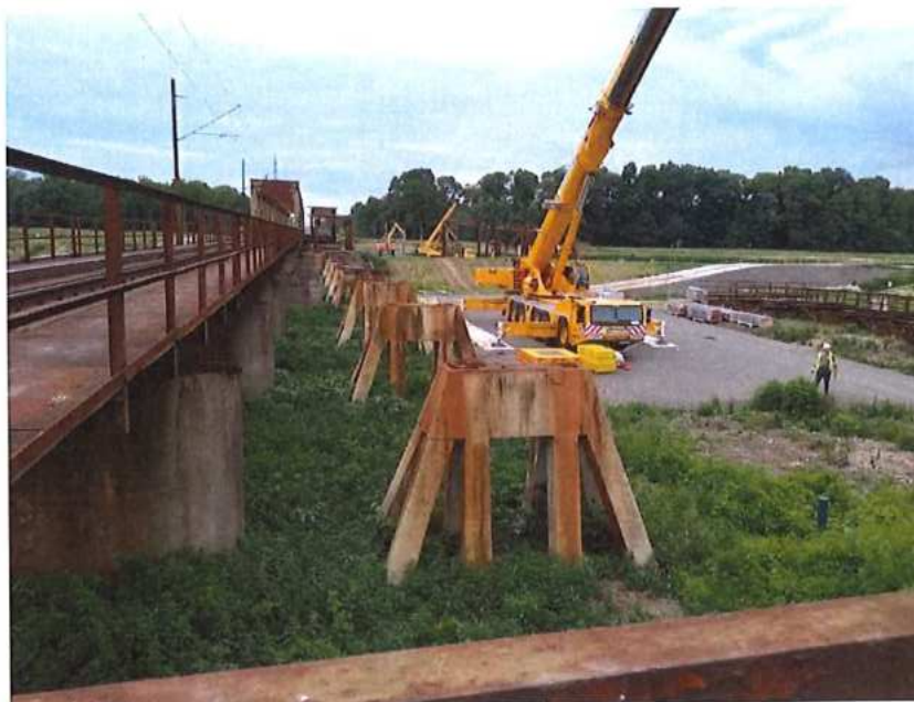
Ukončenie demontáže MK na SK strane