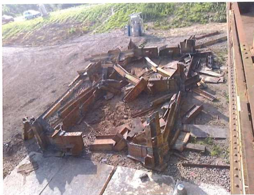
Príprava na odvoz MK na SK strane