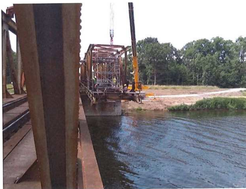
Pokračovanie demontáže MK na CZ strane