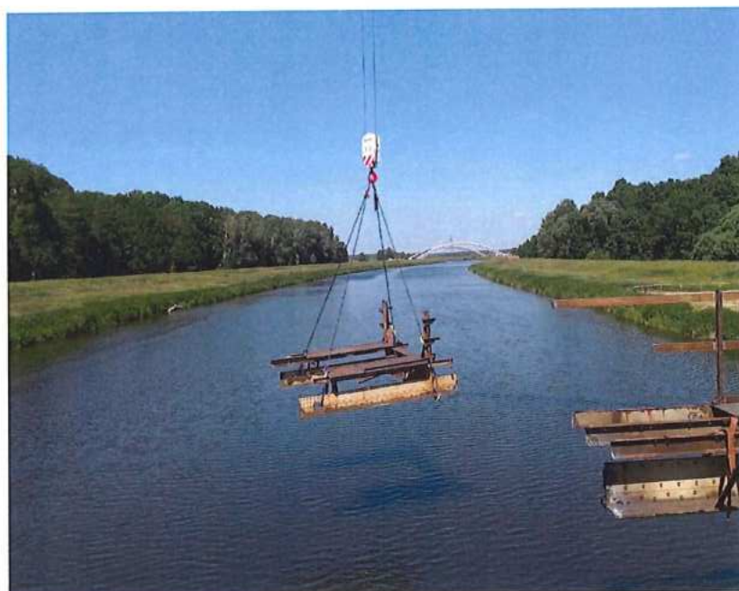
Pokračovanie demontáže MK