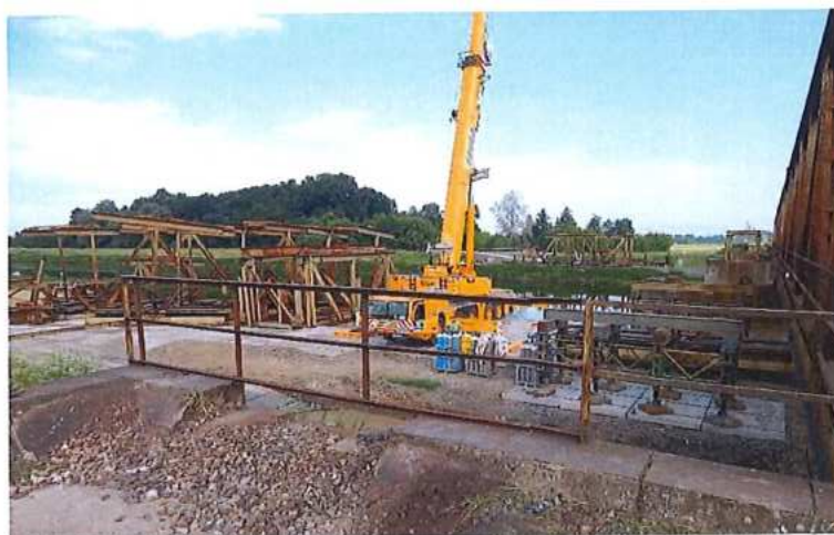
Po demontáži zabezpečenie pracoviska zábradlí

Používanie OOPP - každá osoba musí byť vybavená vhodnými OOPP (v zmysle zákona 124/2006 Z.z.; NV 395/2006 Z.z.; Plánu BOZP) pre všetky riziká, ktorým je vystavená pri vykonávaní konkrétnej práce. Používaná OOPP musí byť schváleného typu (s osvedčením oprávnenej skúšobne pre príslušné riziko a s platnou lehotou na použitie). Zistené nedostatky boli odstránené na mieste..