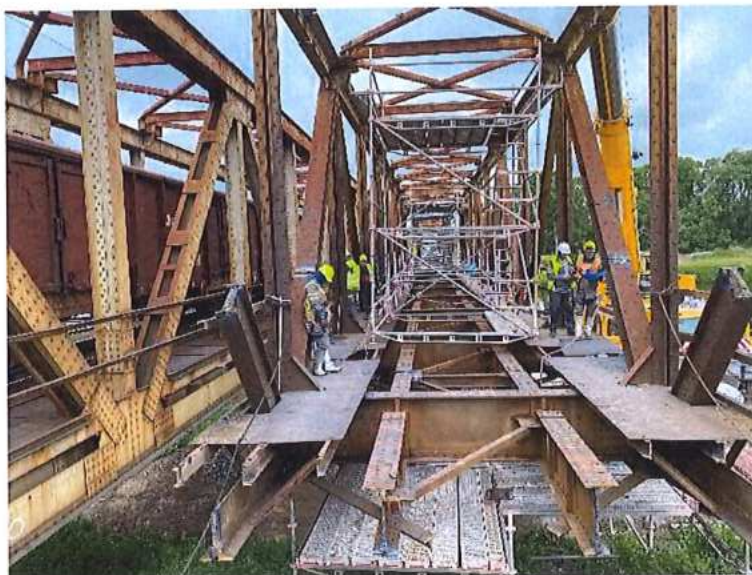
Prerušovanie prác počas prechodu vlakov po koľaji č. 1

jednotlivých etapách a častiach. Zhotoviteľ postupne umiestnil tabule na hranice staveniska , najmä na miesta priamej stavebnej činnosti. Priestory manipulačnej plochy a komunikácií boli dočasne vymedzené bezpečnostnou páskou