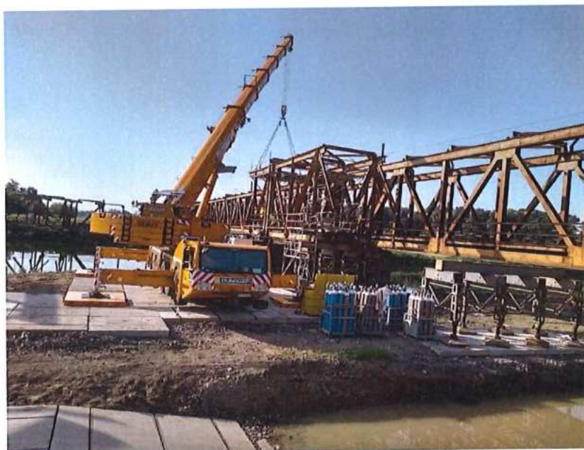
Pokračovanie demontáže MK na CZ strane