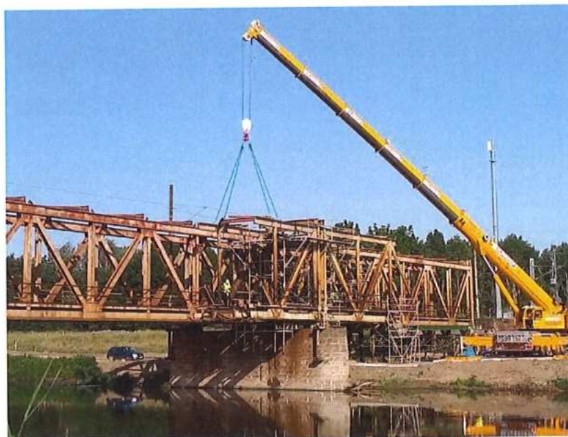
Pokračovanie demontáže MK na CZ strane