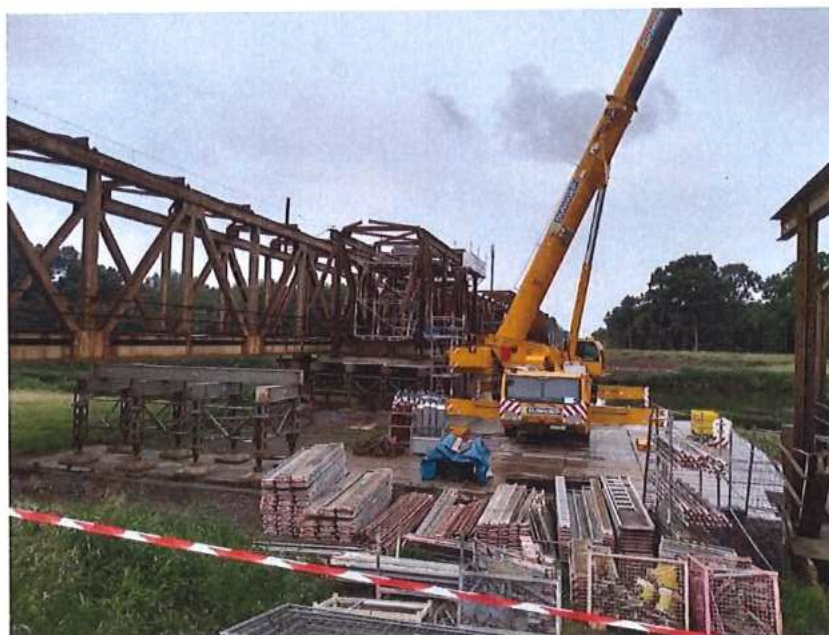
Pokračovanie demontáže MK