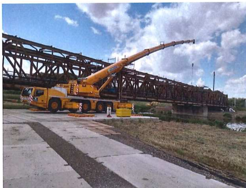
Príprava na demontáž MK