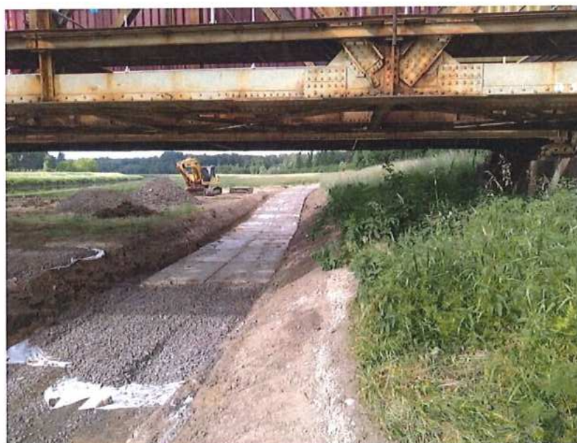
Budovanie prístupovej komunikácie CZ