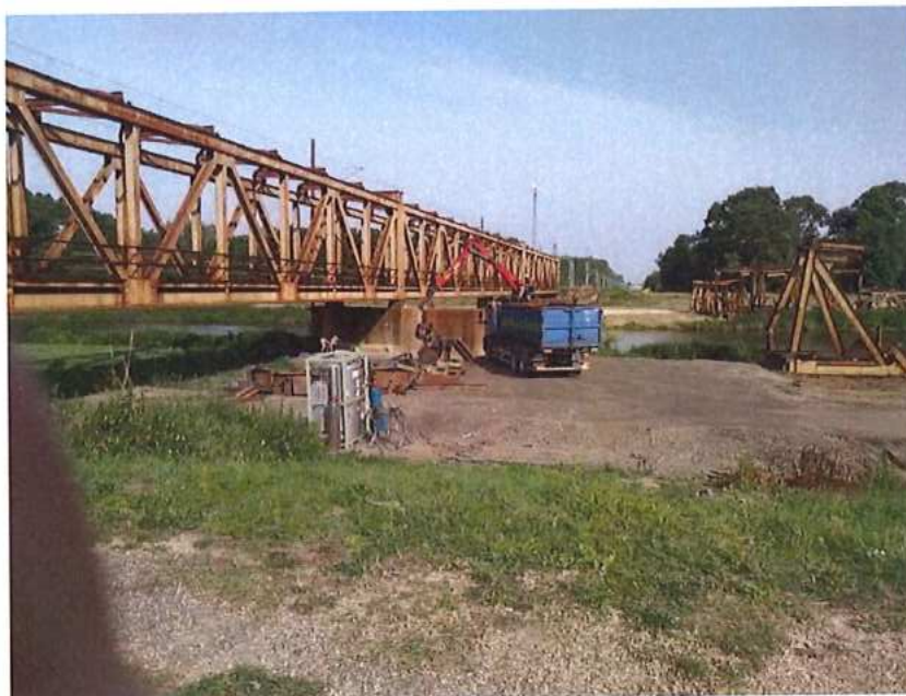
Odvoz MK na SK strane