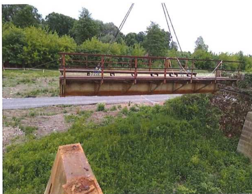
Pokračovanie demontáže MK na SK strane