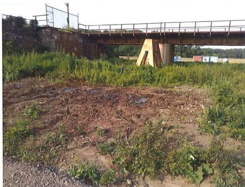
Odvezená MK na SK strane