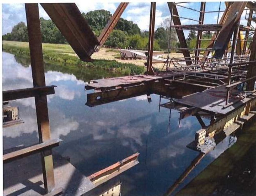
Zahájenie demontáže MK